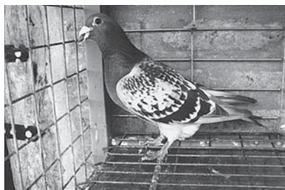
La Holandesa, escamada

Pero si adquirieron palomas de palomares ganadores, tengan por seguro que son palomas sanas, de un palomar con palomas enfermas no se obtienen buenos resultados. No obstante comprar una paloma de excelente sangre no me garantiza que